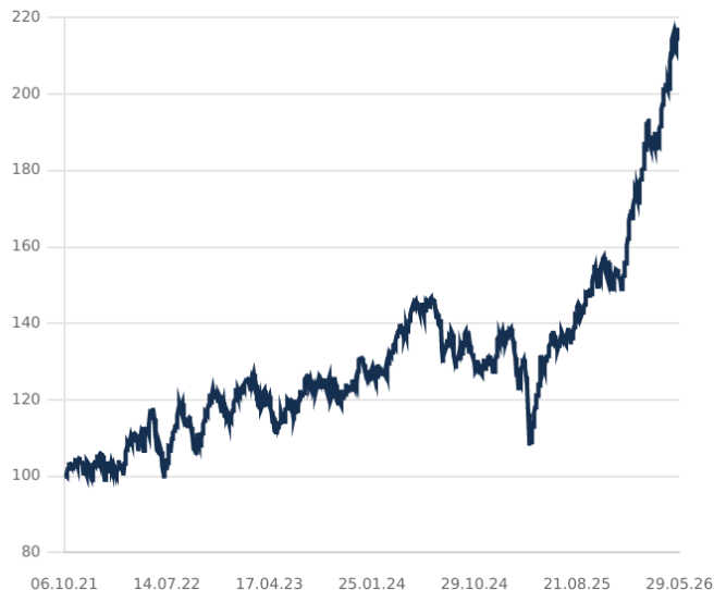
DIP - PARADIGMA VALUE CATALYST EQUITY FUND CLASE C